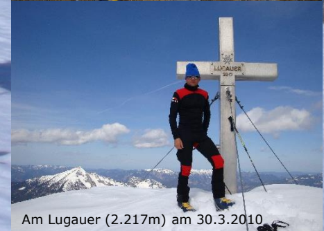
Am Lugauer (2.217m) am 30.3.2010

4.600 Höhenmeter, 6 Gipfel, 1 Tag (13 Stunden)