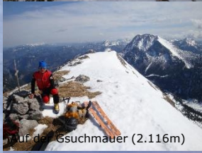
Auf der Gsuchmauer (2.116m)