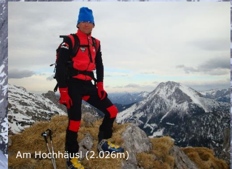
Am Hochhäusl (2.026m)