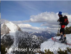
Am Haselkogel (1.870m)