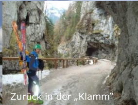
Zurück in der „Klamm“