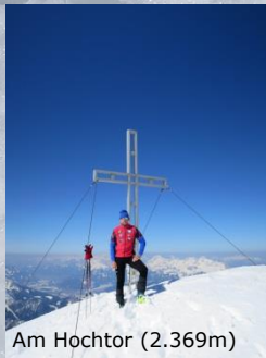
Am Hochtor (2.369m)