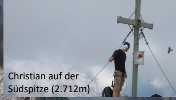
Christian auf der Südspitze (2.712m)