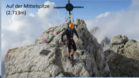
Auf der Mittelspitze (2.713m)