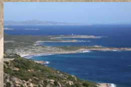
Südküste von Korsika