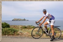
Cap Corse, nördl. Punkt