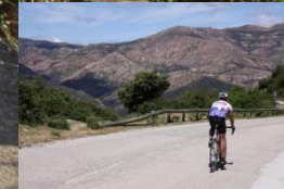
Col de la Vacca