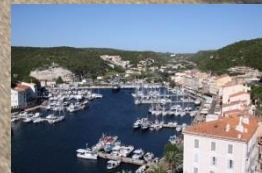
Bonifacio, südl. Punkt