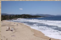
Strand bei Sagone