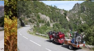
Am Col de Verde