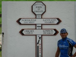
John o Groats