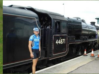
West Highland Zugstrecke