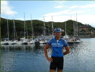
Hafen von Mallaig