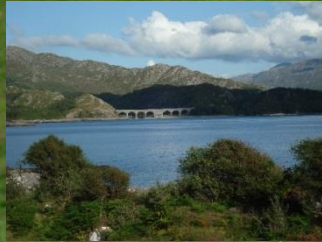
Filmdrehort von Harry Potter