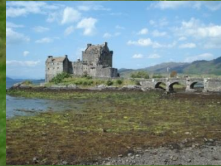
Castle Eilean Donan