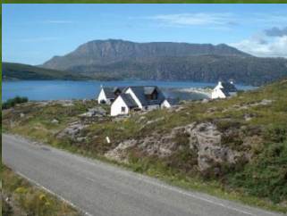
Scourie im Norden