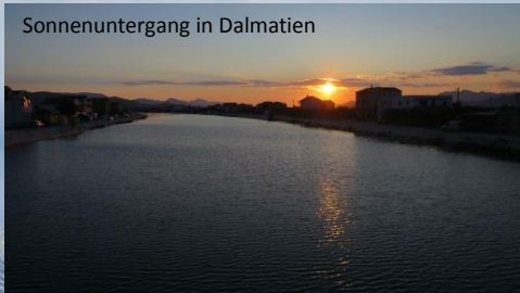
Sonnenuntergang in Dalmatien