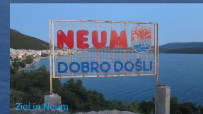
Ziel in Neum