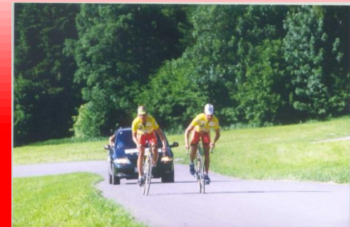
Anstieg auf das Kitzbüheler Horn 1.670m