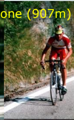
Über den Passo del Muraglione (907m) Apenninen