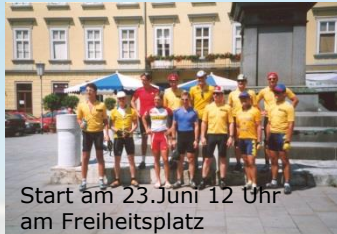
Start am 23. Juni 12 Uhr am Freiheitsplatz

702 km, 2.700 Höhenmeter, 24 Stunden, 31 km/h, 1 Etappe