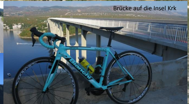
Brücke auf die Insel Krk