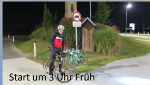
Start um 3 Uhr Früh