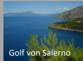
Golf von Salerno