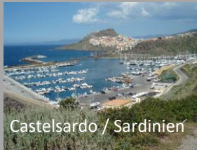
Castelsardo / Sardinien