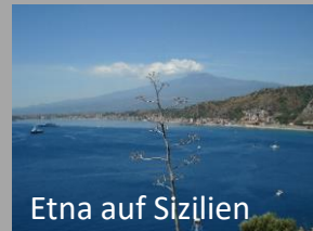
Etna auf Sizilien