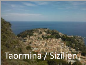
Taormina / Sizilien