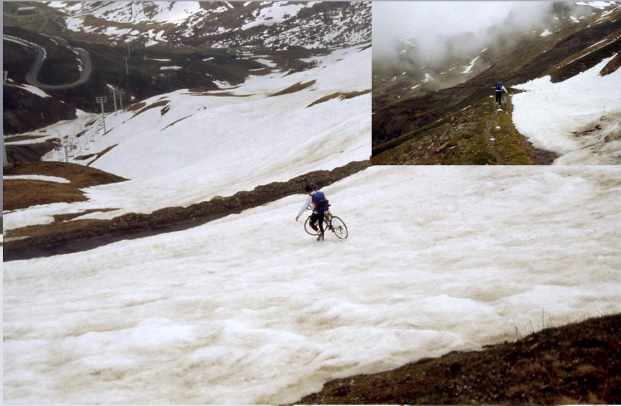
Schnee am Col du Tourmalet