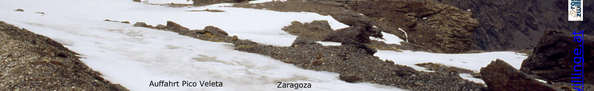
Auffahrt Pico Veleta