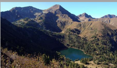
Großer Bösenstein (2.448m)